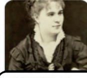
MARIETTA DE VEINTIMILLA