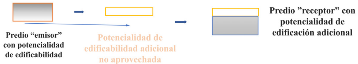
Figura 1 Proceso de DTE

Tal como se puede determinar en el Gráfico 1, se establece que los derechos de transferencia de edificabilidad pueden ser emplazados para cualquier predio. Sin embargo, esto no guardaría sentido si no se busca el precautelar un bien mayor. Para esto, ha prevalecido desde los años 70, como se explicará posteriormente su historia y evolución, el "precautelar", "conservar", "mantener", "restaurar", tanto áreas históricas, bienes que se encuentran en